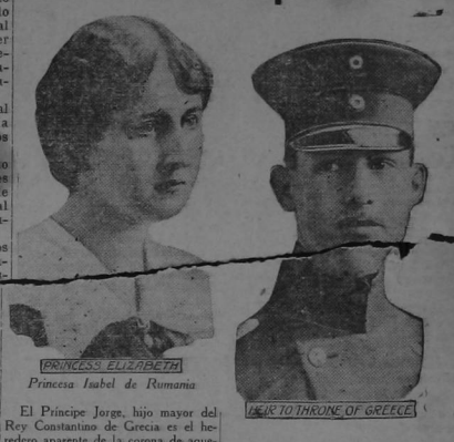
Princesa Isabel de Rumania Príncipe heredero de Grecia

El Príncipe Jorge, hijo mayor del Rey Constantino de Grecia es el heredero aparente de la corona de aquella nación. Tiene veinticinco años de edad y es muy querido y popular en la corte.